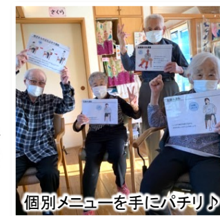
個別メニューを手にパチリ♪

「ここ(デイひだまり)やったらみんなもいてるさかいに頑張れます。」 ご利用者様からこのような感想をいただけるのは、馴染みの仲間と楽しみながらできるからこそ。また、理学療法士の職員がご利用者様と一緒に活動し、お一人お一人に寄り添った個別メニューをご提案しています。